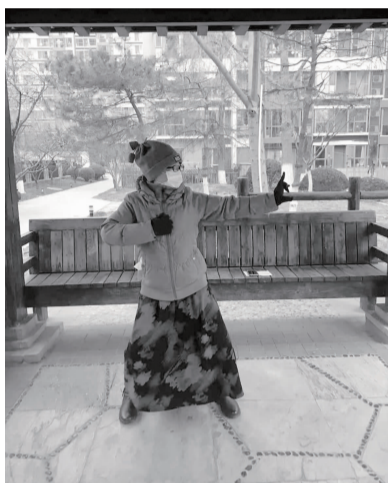
冉冉正在进行八段锦练习