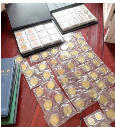
收藏的各类纪念币