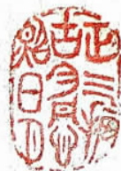
正气振古今 丹心照日月